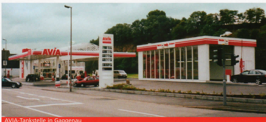
AVIA-Tankstelle in Gaggenau

Ein Unternehmensbereich ist die OEST Tankstellen GmbH & Co. KG. Als Gesellschafter der deutschen AVIA betreibt OEST in Südwest-Deutschland ca. 80 öffentliche Tankstellen mit umfassendem Dienstleistungsangebot. Neben allen üblichen Kraftstoffsorten (auch Bio-Diesel und Erdgas), sowie einem umfangreichen Shop-Sortiment (teilweise mit Bistro) und modernen Auto-Waschanlagen bietet die Mehrzahl unserer Tankstellen auch ein interessantes Paket an fachmännischen Dienstleistungen rund um das Kraftfahrzeug.